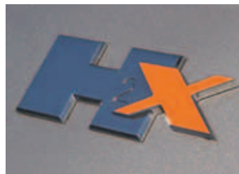
Bureko H2X je designovým klonem HX konceptu, představeného na NAIAS 2008 v Detroitu

Bureko H2X je důkazem, že slogan „zlaté české ruce“ má stále svůj význam. 🏆