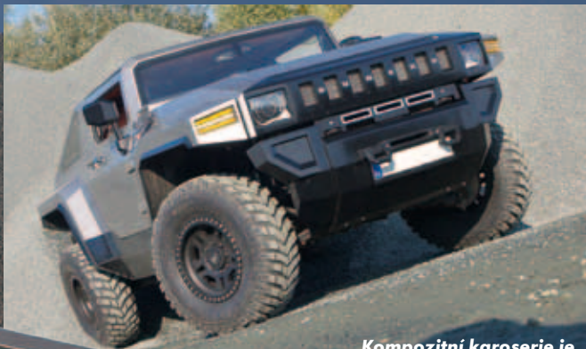
Kompozitní karoserie je připevněna na zkráceném rámu Hummeru H2